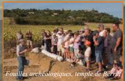
Fouilles archéologiques, temple de Berrut