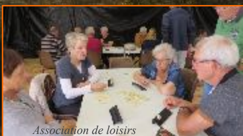
Association de loisirs