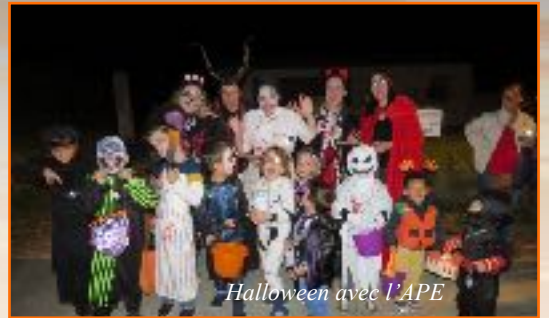
Halloween avec l'APE