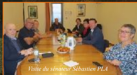
Visite du sénateur Sébastien PLA