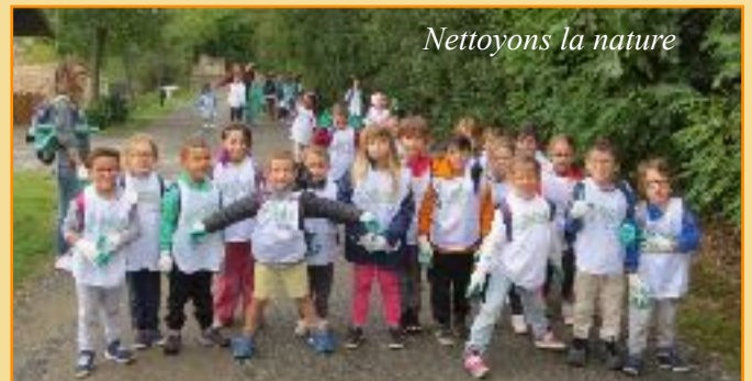
Nettoyons la nature

Les temps consacrés aux activités périscolaires vont aussi s'appuyer sur ce thème à travers des ateliers de discussion autour de la lecture afin de faire émerger des émotions et des comportements mais aussi grâce à l'écoute musicale et la pratique artistique.