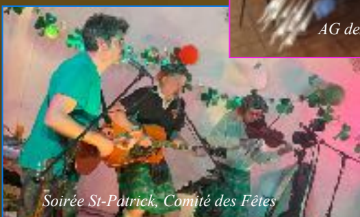
Soirée St-Patrick, Comité des Fêtes