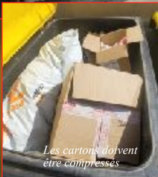
Les cartons doivent être compressés