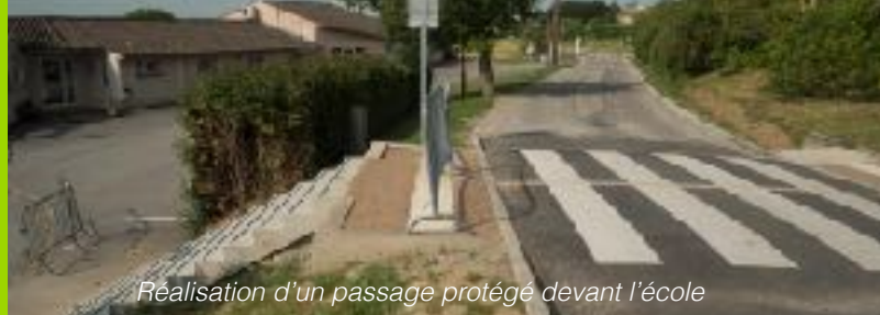
Réalisation d'un passage protégé devant l'école