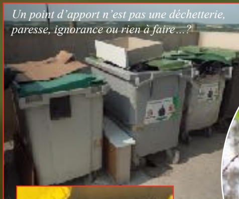
Un point d'apport n'est pas une déchetterie, paresse, ignorance ou rien à faire...?