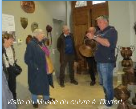
Visite du Musée du cuivre à Durfort