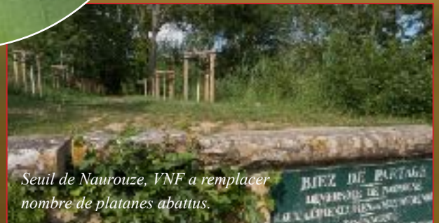
Seuil de Naurouze, VNF a remplacé nombre de platanes abattus.