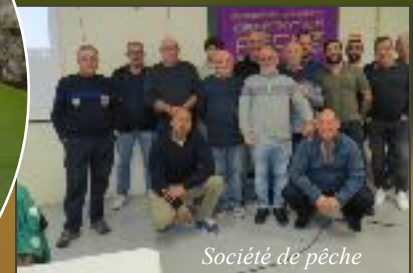
Société de pêche