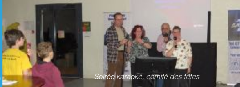
Soirée karaoké, comité des fêtes