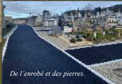
De l'enrobé et des pierres.