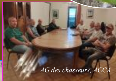
AG des chasseurs, ACCA