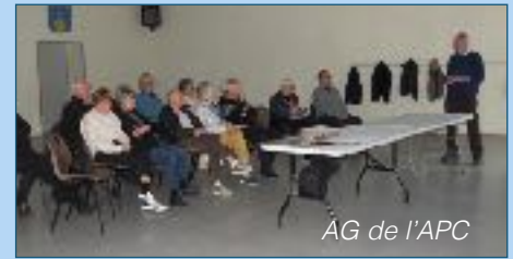
AG de l'APC

L'assemblée générale qui s'est tenue le 22 février 2025 a fait ressortir un véritable dynamisme de l'association qui a connu une année 2024 très riche en événements. L'ensemble de la population a été invité à des sorties, des conférences et des stands organisés par ses membres.