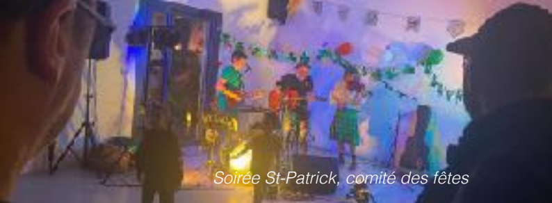
Soirée St-Patrick, comité des fêtes