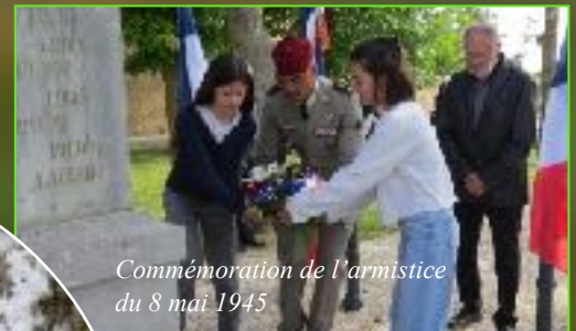
Commémoration de l'armistice du 8 mai 1945