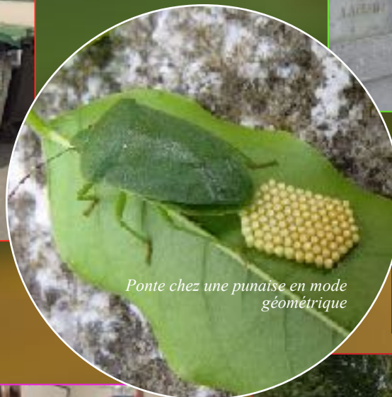
Ponte chez une punaise en mode géométrique