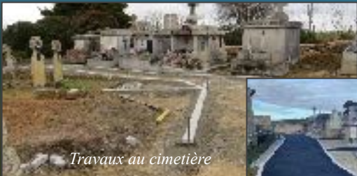
Travaux au cimetière