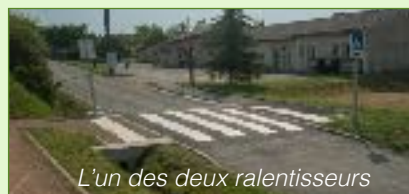
L'un des deux ralentisseurs

On rappelle également que cette partie de route est intégrée à une zone 30 km/H et que c'est la condition pour circuler tranquillement et éviter tout risque manifeste.