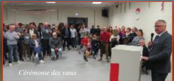
Cérémonie des vœux