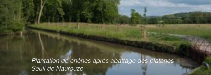
Plantation de chênes après abattage des platanes Seuil de Naurouze