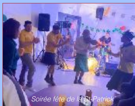
Soirée fête de la St-Patrick