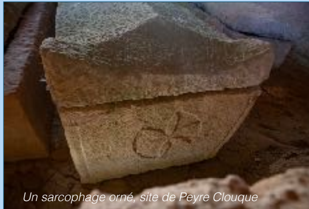
Un sarcophage orné, site de Peyre Clouque

Si nos activités vous intéressent, vous pouvez prendre contact.