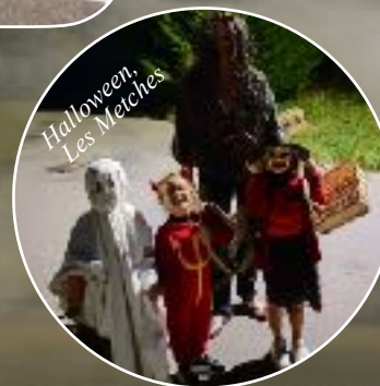
Halloween, Les Mèches