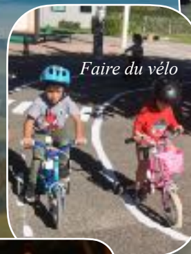
Faire du vélo