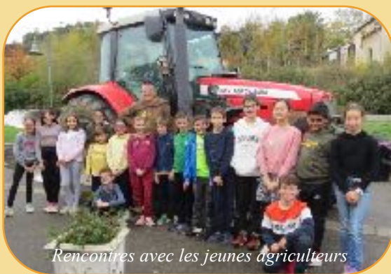
Rencontres avec les jeunes agriculteurs