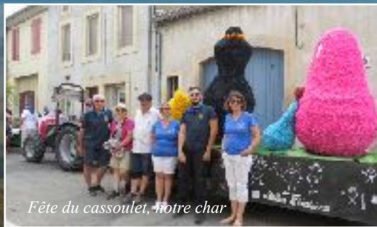
Fête du cassoulet, notre char