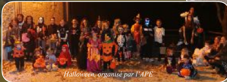
Halloween, organisé par l'APE