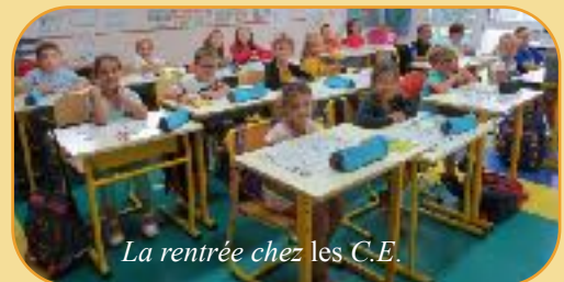
La rentrée chez les C.E.