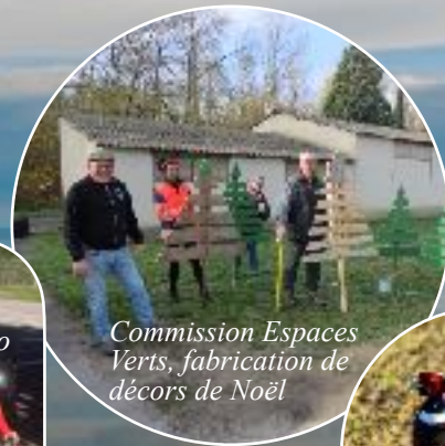
Commission Espaces Verts, fabrication de décors de Noël